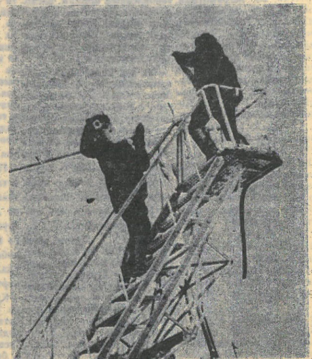
В Таркосалинском аэропорту