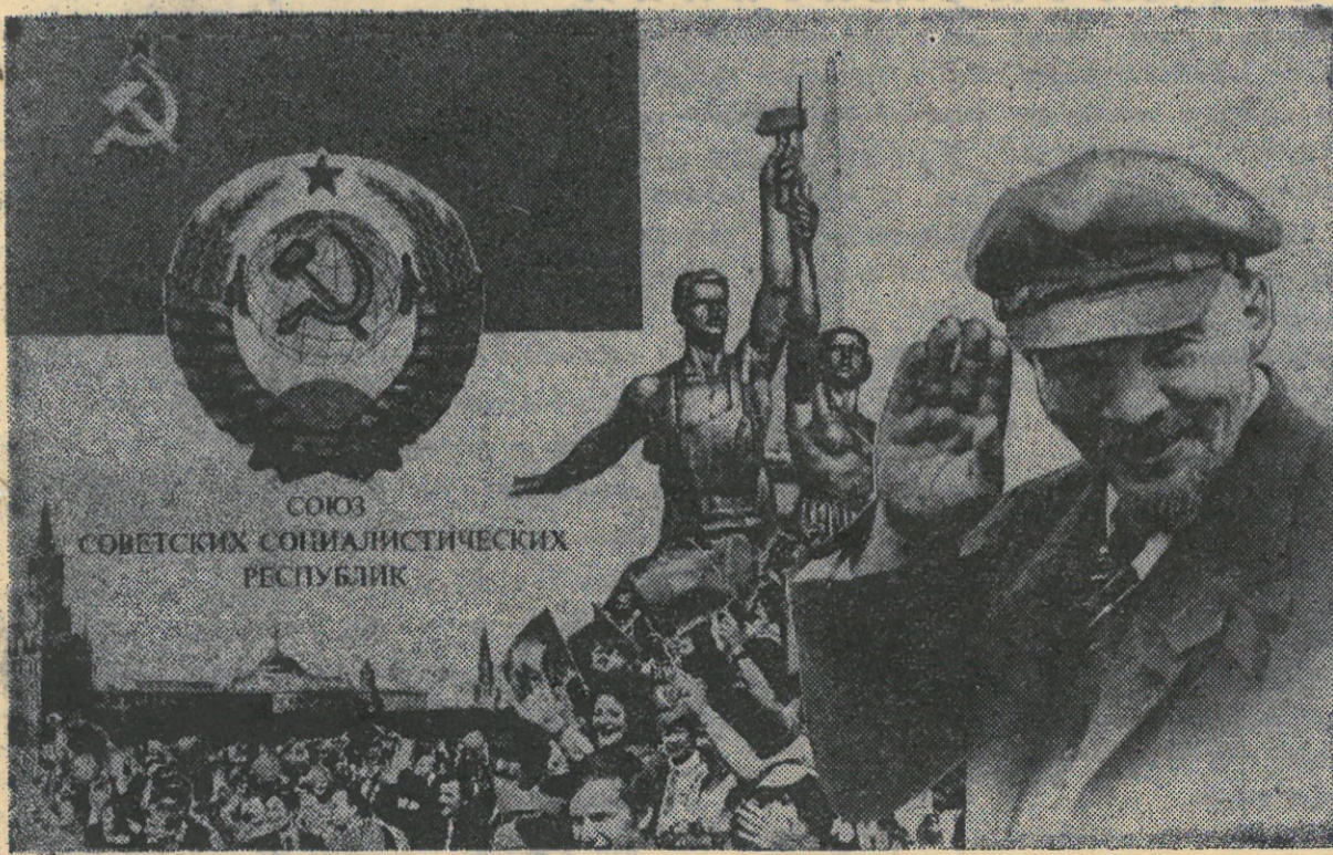
ПЛАКАТ ХУДОЖНИКА В. ПРОХОРОВА. ИЗДАТЕЛЬСТВО «ПЛАКАТ».