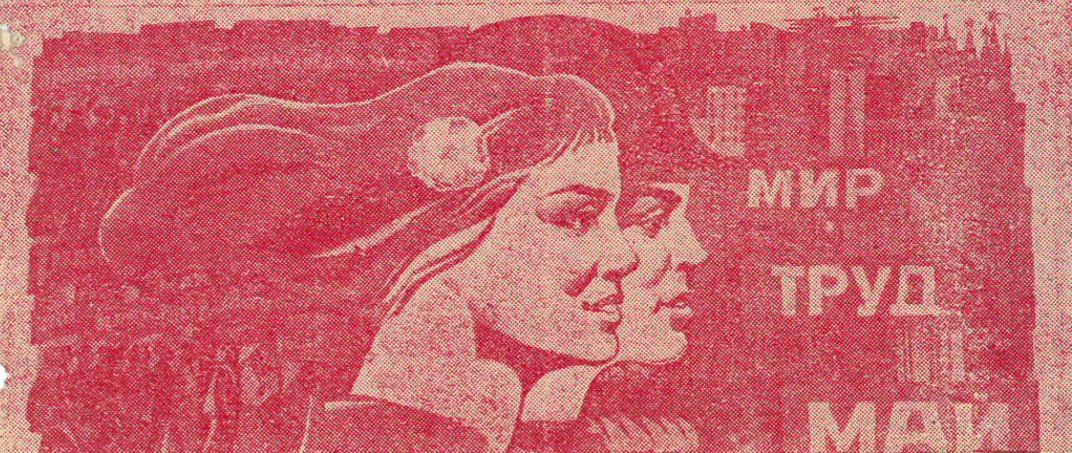
Плакат художника Э. АРЦУНЯНА. Издательство «ПЛАКАТ».

ДА ЗДРАВСТВУЕТ 1 МАЯ — ДЕНЬ МЕЖДУНАРОДНОЙ СОЛИДАРНОСТИ ТРУДЯЩИХСЯ В БОРЬБЕ ПРОТИВ ИМПЕРИАЛИЗМА, ЗА МИР, ДЕМОКРАТИЮ И СОЦИАЛИЗМ!