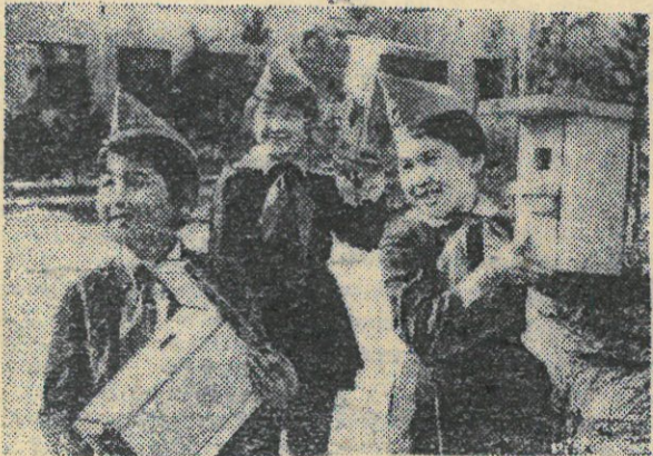
Юные друзья природы.