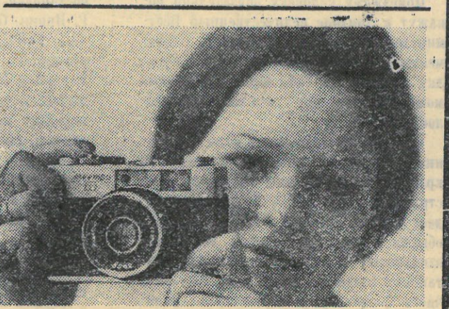
Редактор Б. КАСАЕВ

Пуровский райвоенкомат приглашает всех участников Великой Отечественной войны, проживающих на территории района, получить временные удостоверения, в которых указаны льготы ветеранам войны.