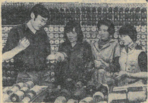
УЛАН-БАТОР. На ковровой фабрике. Проверяется качество пряжи.