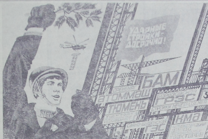
Плакат художника В. Фекляева «Ударные стройки — досрочно!». Издательство «Плакат».