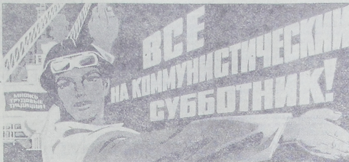
Плакат художника Б. Решетникова. Издательство «Плакат».

ОРГАН ПУРОВСКОГО РАЙОННОГО КОМИТЕТА КПСС И РАЙОННОГО СОВЕТА НАРОДНЫХ ДЕПУТАТОВ ЯМАЛО-НЕНЕЦКОГО АВТОНОМНОГО ОКРУГА ТЮМЕНСКОЙ ОБЛАСТИ