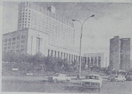
Москва. Вид на Дом Советов РСФСР и здание СЭВ. Фото В. Кошевого (Фотохроника ТАСС).