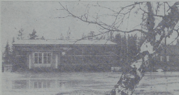
Недавно столовая ГПП «Выпургаздобыча» навела «косметический ремонт», улучшены условия труда.

19 декабря — «Дикая собака Динго». Начало в 15 часов. «Частный детектив». Начало в 19 и 21 час. 20 декабря — «Частный детектив». Начало в 19 и 21 час. 21 декабря — «Марка страны Ганделуцы». Начало в 15 часов. «Генрих VIII и его 6 жен». Начало в 19 и 21 час. 22 декабря — «Генрих VIII и его 6 жен». Начало в 19 и 21 час. 23 декабря — «Иезуиты». Начало в 19 и 21 час. 24 декабря — «Город под липами». Начало в 15, 19 и 21 час.