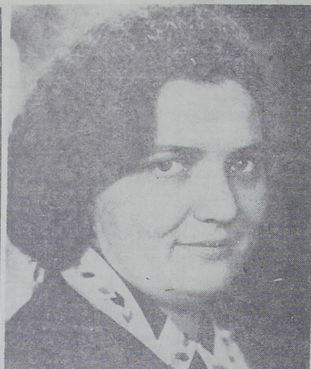
Трудная работа связистов. Особенно на Севере, где почта наиболее обильная.

В первом же году одиннадцатой пятiletки значительно укрепится производственная база. Намечено построить пекарню, холодильник на 220 тонн, свинарник, магазины, теплые и холодные склады. Целая база будет построена на железнодорожной станции Тихай. Как видите, сделать предстоит много. Мы приложим все силы, чтобы выполнить намеченное.