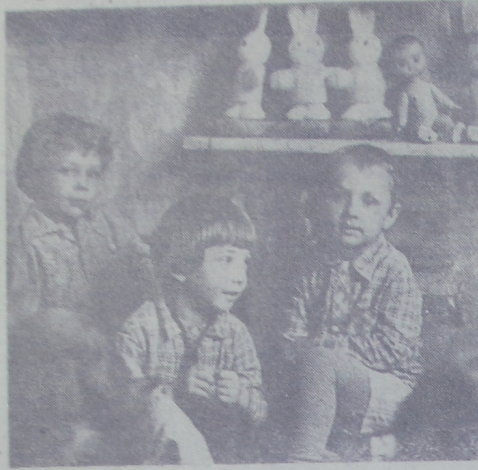
Заинтересованный разговор.