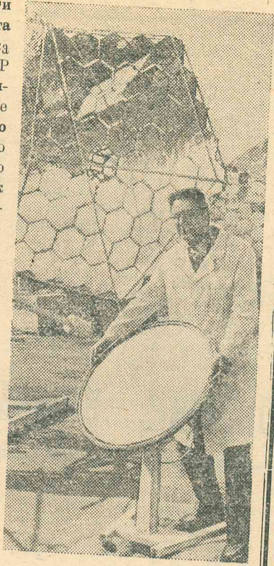
собирая энергию солнечных лучей и превращая ее в тепловую.

Серебристые чаши гелиоустановок — зеркальные концентраторы поворачиваются вслед за дневным светилем,