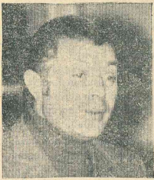
В. Г. Чертков.