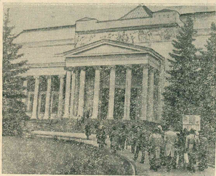
Москва. Государственный музей изобразительных искусств имени А. С. Пушкина — один из крупнейших в на

шей стране, второй по значению после Эрмитажа музей зарубежного искусства.