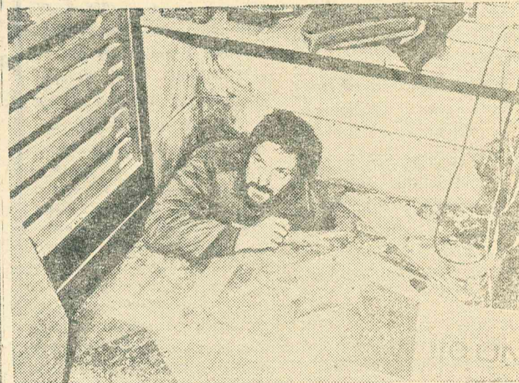
ЗА ФАСАДОМ «СВОБОДНОГО МИРА»