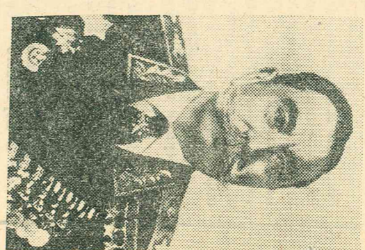
25 апреля — 100 лет со дня рождения С. М. Буденного (1883—1973)

Выдающийся заслуги С. М. Буденного были высоко оценены Коммунистической партией и Советским государством. Он трижды удостоен звания Героя Советского Союза, награжден многими орденами и медалями нашей страны и иностранных государств.