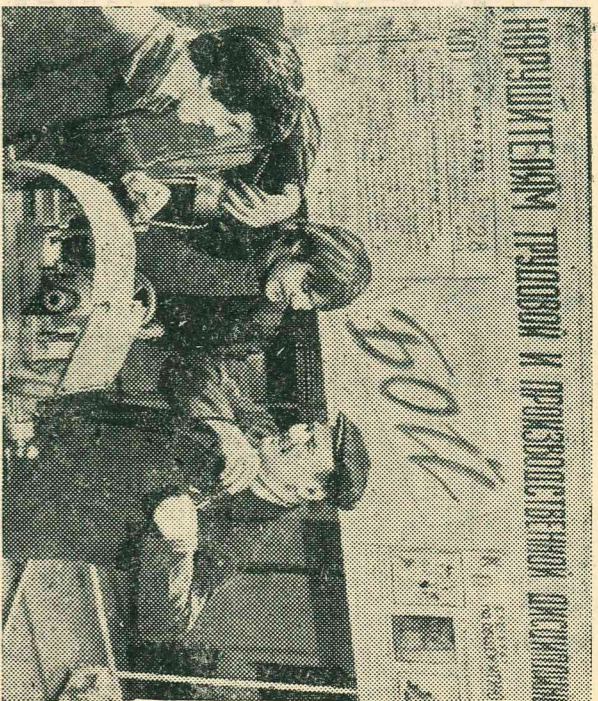
КИРПИЗСКАЯ СР. Дисциплина, четкость, высокая организованность — вот главные успехи коллектива Фрунзенского опытного завода электровакуумного машиностроения, который уверенно лидирует в социалистическом соревновании среди предприятий республике.

В создавшейся обстановке — слово за строителями и шефами, не исключая руководителей ПГЗ.