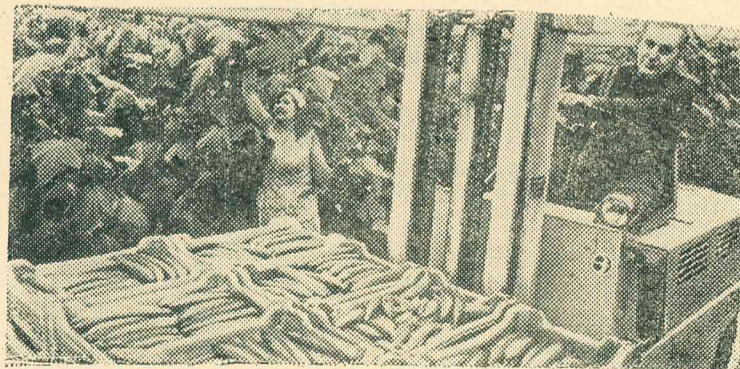
ЭСТОНСКАЯ ССР. В теплицах Коктла-Ярвского отделения объединения «Агро» Эстонского республиканского союза потребителей обществ в качестве искусственной почвы применяется измельченная кора хвойных деревьев, обогащенная необходимыми компонентами минеральных удобрений. Основа субстрата дешевая, так как получают ее из отходов Пюссиского комбината древесных плит, расположенного неподалеку от тепличного хозяйства.

Начался новый этап развития гиганта на Вычегде — освоение четвертой бумагоделательной машины второй очереди (на снимке). Мощность новой бумагоделательной машины финской фирмы «Валмет» — 180 тысяч тонн книжно-журнальной бумаги в год.