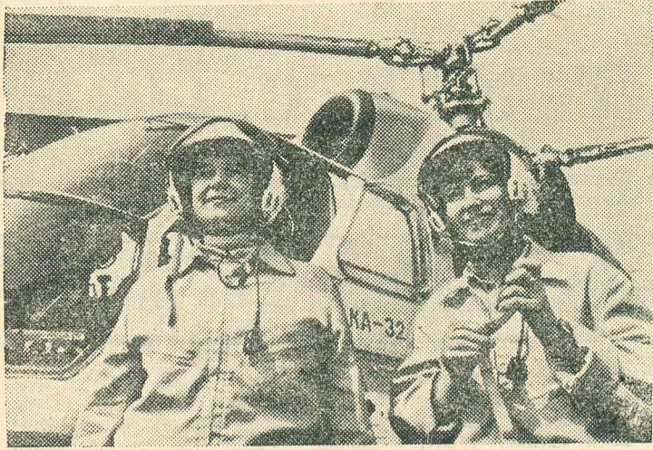
МОСКВА. Успешно проходит проверку в различных климатических условиях вертолет КА-32, созданный в конструкторском бюро имени Н.И. Камова. Небольшая по размеру

машина с двумя винтами на одной оси способна носить на внешней подвеске грузы весом более пяти тонн. Она обладает большим запасом мощности, хорошей энерговооруженностью, оснащена современным оборудованием. Вертолет найдет широкое применение на строительном-монтажных работах, в сельском хозяйстве. Высокие летные качества дадут возможность эффективно использовать его в условиях высокогорья.