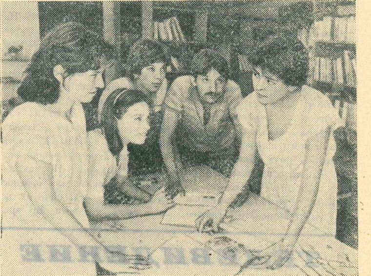
НИКАРАГУА. Более двух лет прошло со дня образования АНАПС — Никарагуанской ассоциации дружбы с народами социалистических стран. В ее задачу входит ознакомление жителей республики с достижениями государств социалистического содружества во всех областях экономической, социальной и политической жизни. На снимке: в библиотеке ас социации.