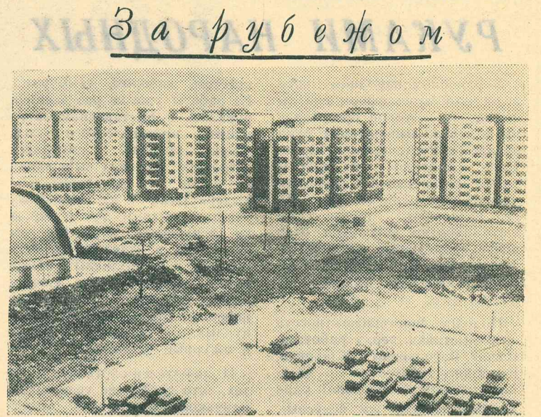
XIV зимние Олимпийские игры пройдут в феврале 1984 года в югославском городе Сараево.