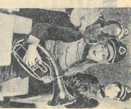
ХАВАРОВСКИЙ КРАЙ. Традиционное представление о том, что в духовом оркестре играют мужчины, опровергли девушки педагогического института в Комсомольске-на-Амуре.