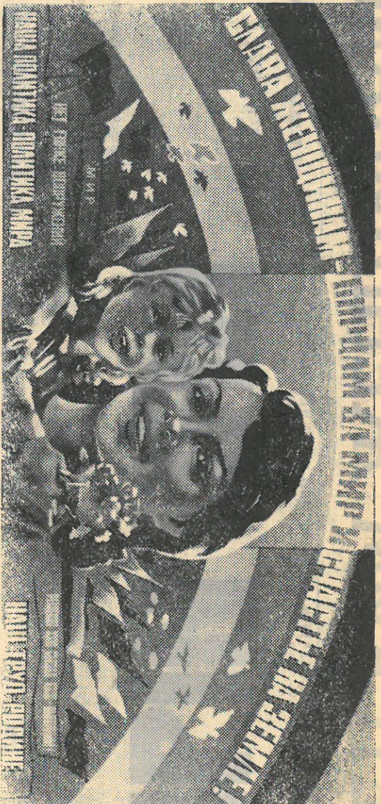
Плакат художников Л. Балского и В. Попова.