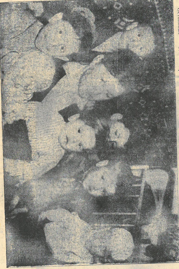
тел, как говорят, на родного незда. И душа за него спокойна — хороший человек вырос. Так, глядишь, и остальные поднимутся... Остальные — это пятеро зе

Понятия гордость матери за сына. Давно ли был мальчишкой, а вот уже и вырос, уже