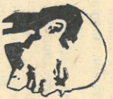
ПОЗЫВНЫЕ „КРАСНОЙ СУББОТЫ“

Такие телеустановки уже действуют на площадях Воен-То и Харампур, позволяя нефтегазведчикам смотреть теле-