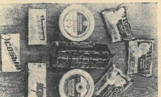
На снимках: на участке фасовки растительного масла; ассортимент продукции, выпускаемой комбинатом.

Над выпуском работали: Корректор И. Аманенко. Дизайнеры: Т. Рассохина, Метранаж: В. Анисимова, Печатник: Т. Сурашенко.