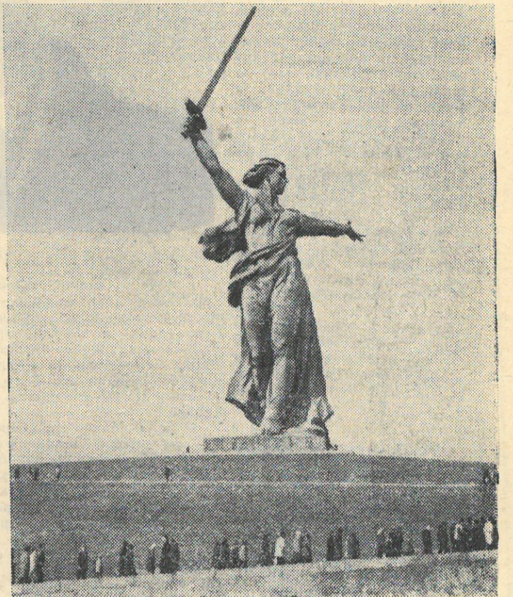
На Мамаевом кургане.