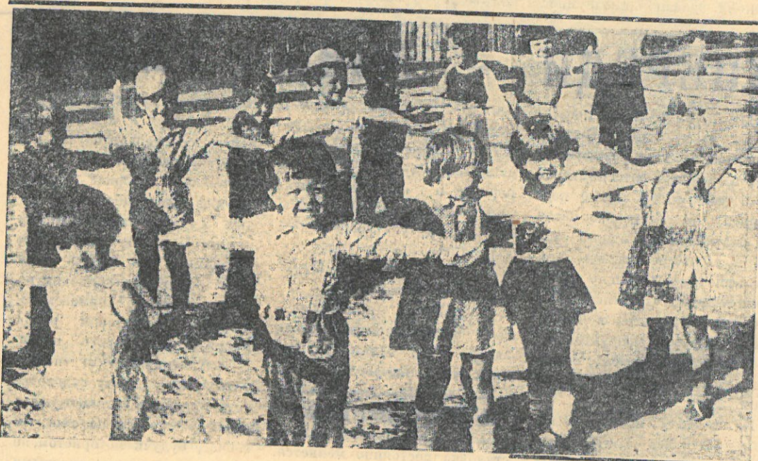
Редактор В. МОТИН.

Претворить все намеченное в жизнь удастся лишь укрепив спортивную базу поселка. Сейчас на берегу Пура силами физкультурников ДСО «Урожай» строится лыжная база, будут сделаны спортивные площадки по волейболу и городскому спорту. На территории АТП ведется строительство стрелкового тира.