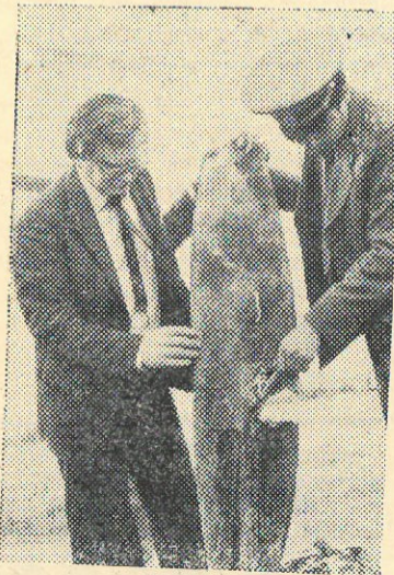
Отыскались и его однополчане.