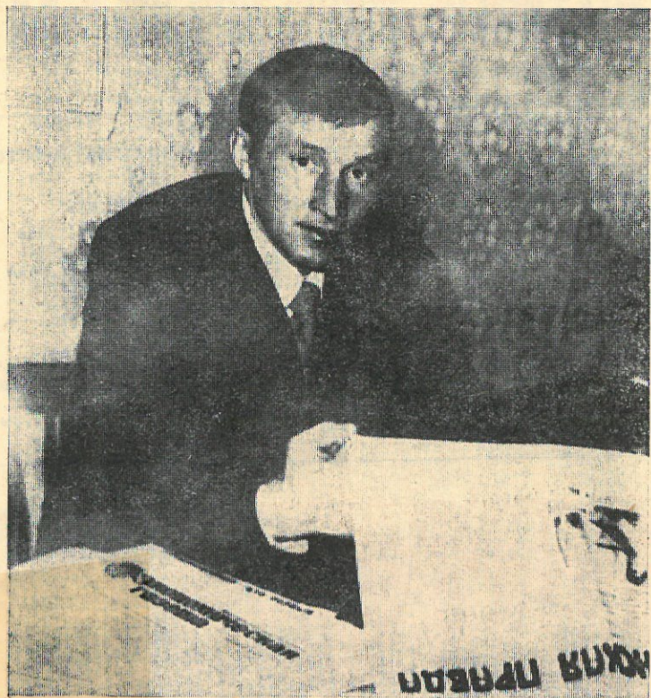
КОММУНИСТ И ЕГО ДЕЛО