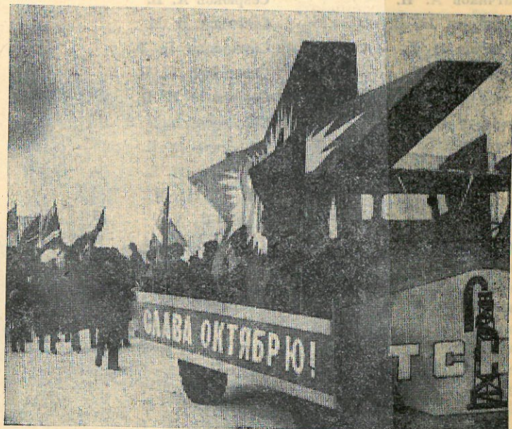
НА СНИМКАХ: сверху — начало праздничной демонстрации; внизу — идет колонна Таркосалинской НРЭ.

Уверенно набирает производственные темпы молодой коллектив Южно-Таркосалинской (Продолжение на 2 стр.)