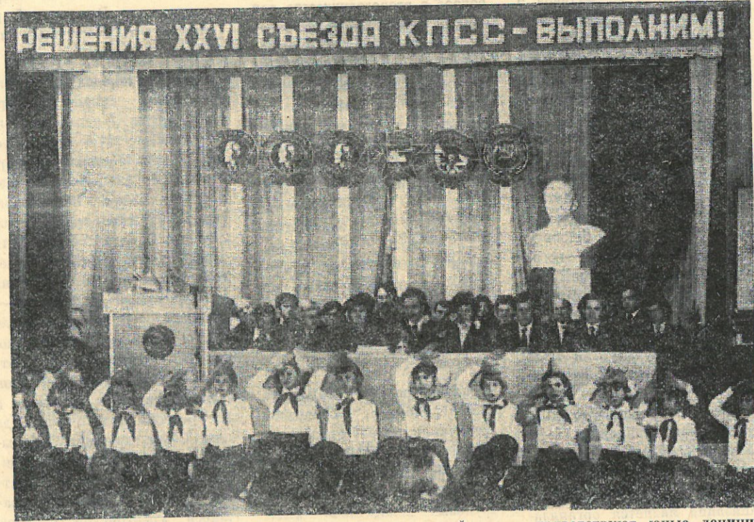
НА СНИМКЕ: делегатов комсомольской конференции приветствуют юные ленинцы.