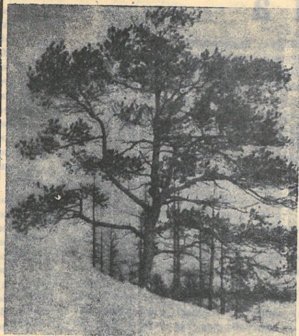
Строга и скромна красота природы Севера. Но, неброская, непышная, она дорога сердцу истинного северянина, радуя в любое время года.