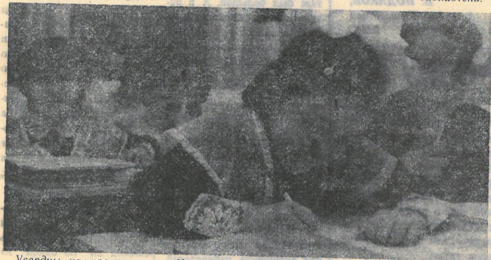
Усердны на уроках первокурсники. На снимке: занятия в 1 «Г» классе Таркосалинской средней школы.