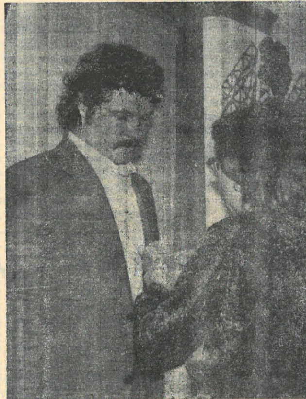
листическое соревнование, посвященное выборам в Верховный Совет РСФСР и в местные Советы народных депутатов. В первых рядах соревнования идут люди, имена которых широко известны пуровчанам. Это те, кто проработал на стройках Тарко-Са

построены десятки тысяч квадратных метров жилья, много других объектов. И в каждый они вложили частичку своей души.