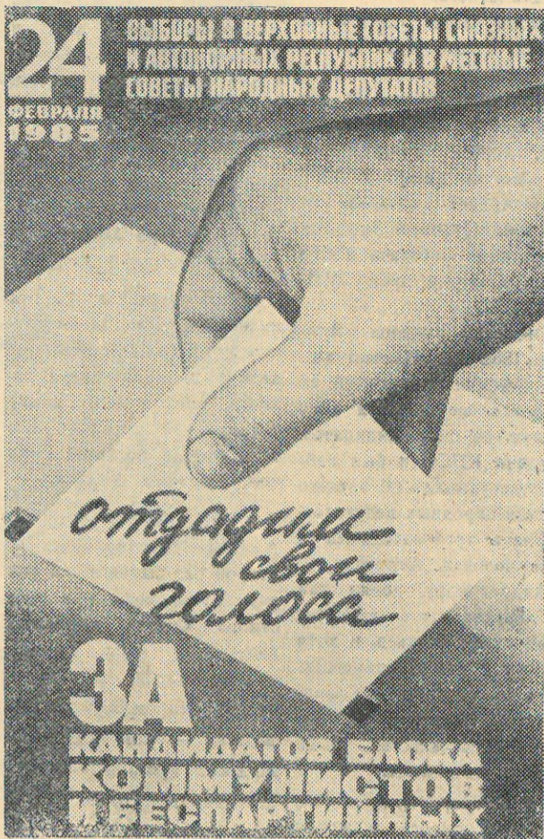
Плакат художника А. Рудковича.

Под знаком дальнейшего развития социалистической демократии пришли пуровчане к выборам. На предвыборных совещаниях трудящиеся единодушно поддержали кандидатов нерушимого блока коммунистов и беспартийных.