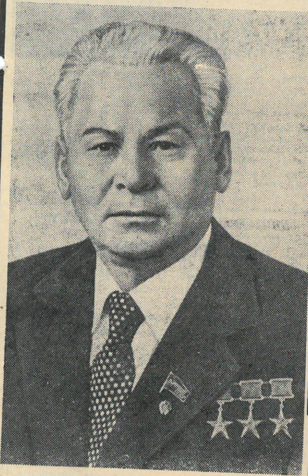
ОТ ЦЕНТРАЛЬНОГО КОМИТЕТА КОММУНИСТИЧЕСКОЙ ПАРТИИ СОВЕТСКОГО СОЮЗА, ПРЕЗИДИУМА ВЕРХОВНОГО СОВЕТА СССР, СОВЕТА МИНИСТРОВ СССР

Траурные митинги прошли во всех населенных пунктах нашего района.