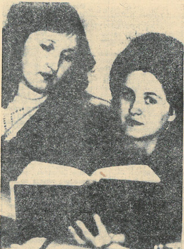
Ударным трудом решили отметить 40-летие Великой Победы работники железнодорожной станции Пуровск.