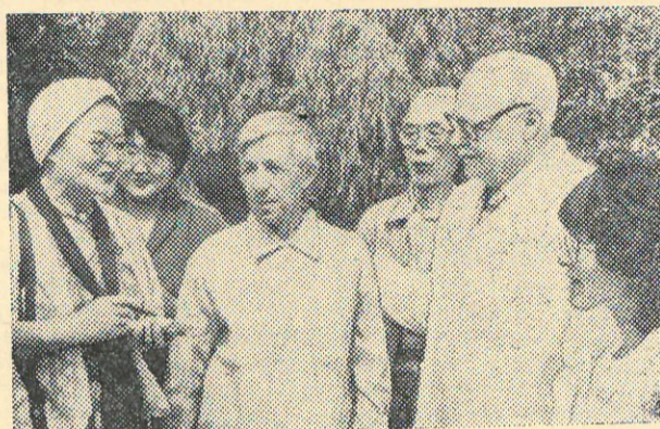
жизнедеятельности активную жизненную позицию, участие в делах общества.

Пожилые люди с вниманием относятся к рекомендациям специалистов, геронтологов, время от времени проходят в институте курс лечения, в котором используются эффективные витаминизированные и другие препараты. Но сами долгожители и следящие за их здоровьем врачи считают решающим условием их