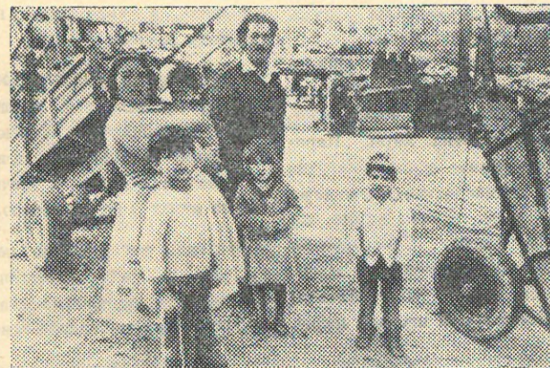
ИСПАНИЯ. Число безработных в Испании, согласно опубликованным здесь официальным данным, в настоящее время превышает 2,6 млн. человек, что составляет около 20 процентов всего трудоспособного населения.

На снимке: безработные и бездомные жители Мадрида.