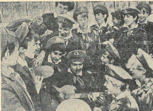
На снимке: репетирует агитбригада.

Как и вся страна, «Орленок» готовится к XII Всемирному фестивалю молодежи и студентов в Москве. Постоянными стали выездные концерты агиттеатра и ярмарки солидарности. Ребята изготавливают различные сувениры, деньги от их продажи перечисляют в фонд фестиваля. Готовят они и подарки участникам форума молодежи.