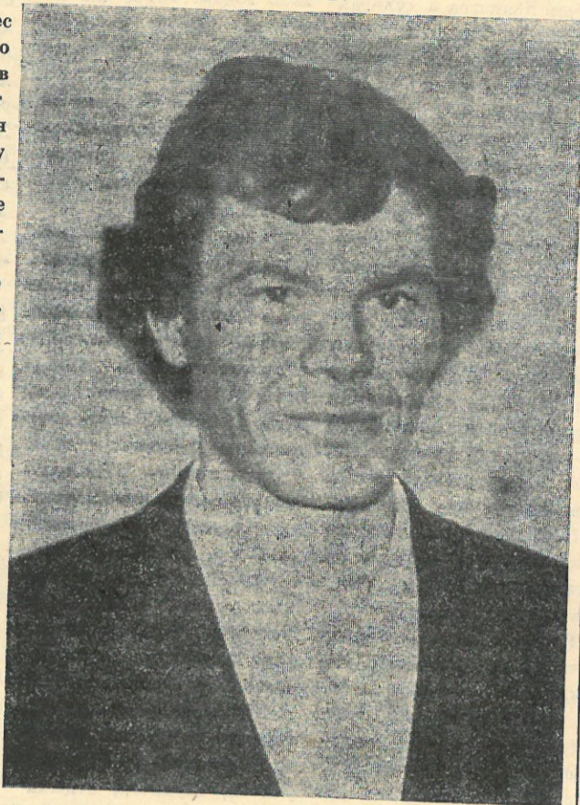
Фото и текст В. Резуна.