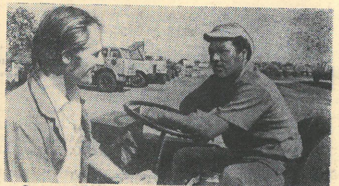
Советский Союз оказывает никарагуанскому народу братскую помощь в развитии национальной экономики. Большое значение для революционной республики имеют поставки советской техники. В ее освоении и использовании никарагуанцам помогают советские специалисты.