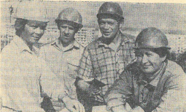
Посланцы специализированного строительного-монтажного поезда «Укрстрой» завершили строительство жилья в поселке Новый Ургал Восточного участка БАМа. Ежегодно, выполняя государственный план на 120—130 процентов, коллектив ССМП опередил график в целом на 1,5 года.

Ю. ВИЛКОВ, председатель районного комитета НК.