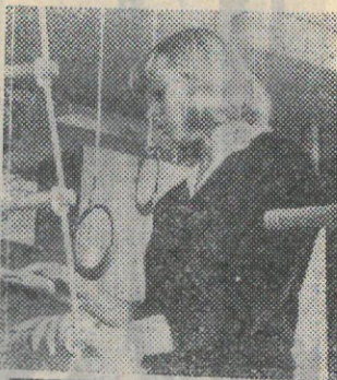
Редактор В. МОТИН.