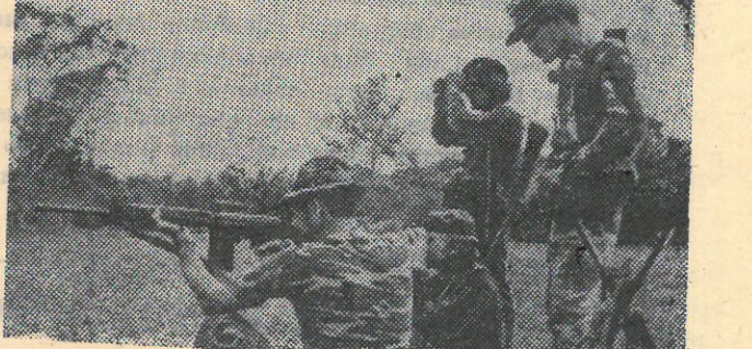
На снимке из журнала «Солджер оф форчун» — американские военные советники упражняются с никарагуанскими контрреволюционерами в меткой стрельбе. Необходимые навыки, полученные таким образом, бандиты используют, убивая ни в чем не повинных стариков, женщин, детей. Убийства и террор, творимые «контрас» на территории Никарагуа, щедро оплачиваются американскими долларами.

Засылая контрреволюционные формирования на территории суверенной страны, Соединенные Штаты стремятся дестабилизировать положение в ней, подорвать народную поддержку революционным преобразованиям, заставить правительство Никарагуа изменить свой независимый внутри- и внешнеполитический курс. С этой целью Соединенные Штаты пытаются задушить республику при помощи торгово-экономических санкций.