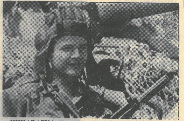
НИКАРАГУА. За короткий срок, прошедший после свержения кровавой диктатуры Сомосы, революционная республика смогла сформировать современные вооруженные силы, которые твердо стоят на страже революционных завоеваний.