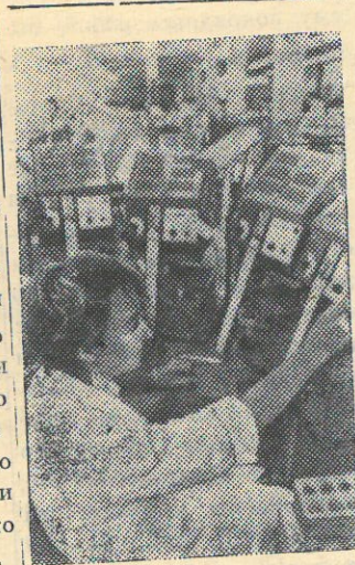
МОСКВА. Коллектив производственного объединения «Второй часовой завод» усердно трудится над завершением планов последнего года XI пятилетки. Администрация и профком проводят систематическую работу по улучшению социально-бытовых условий трудящихся. На снимке: в сборочном цехе.