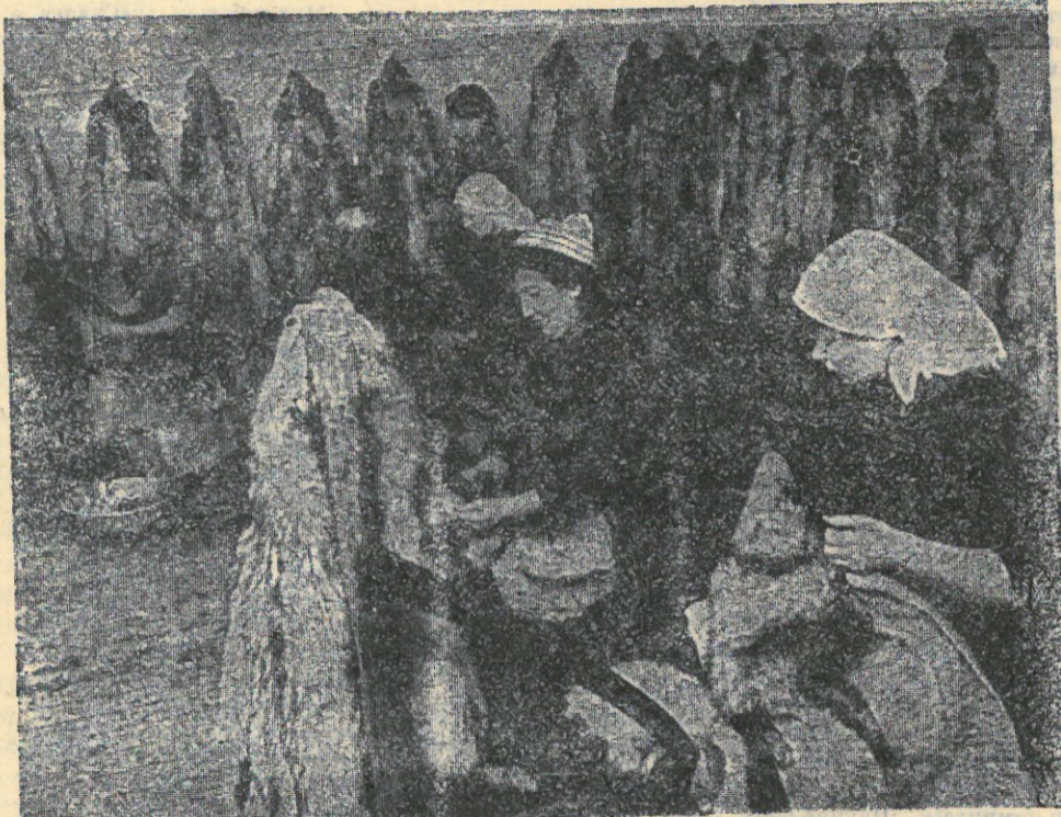
На снимке: идет обработка пушнины.