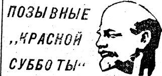
ПОЗЫВНЫЕ „КРАСНОЙ СУББОТЫ“

Райкому ВЛКСМ необходимо организовать обсуждение задач, вытекающих из Политического доклада ЦК КПСС, решений съезда, во всех комсомольских организациях обеспечить изучение документов съезда в системе комсомольской учебы, вести широкую пропаганду их среди молодежи в разнообразной, доходчивой форме, выработать и осуществить меры по усилению трудового, идейно-политического и нравственного воспитания молодежи, по совершенствованию форм и методов комсомольской работы.