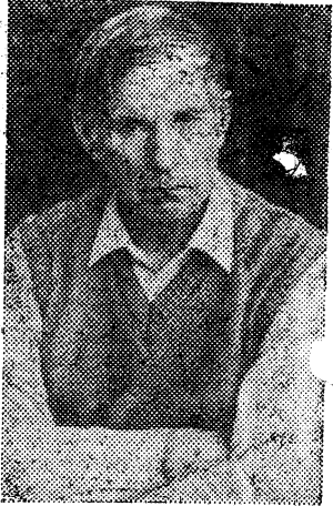
Редактор В. МОТНВ.

Творчество Героя Социалистического Труда народного писателя Белоруссии Василия Быкова широко известно советским и зарубежным читателям. Война в повестях В. Быкова — страшная трагедия для всего народа и в то же время испытание духовных качеств каждого человека. Даже в безвыходных ситуациях, в минуты смертельной опасности каждый из них остается человеком.