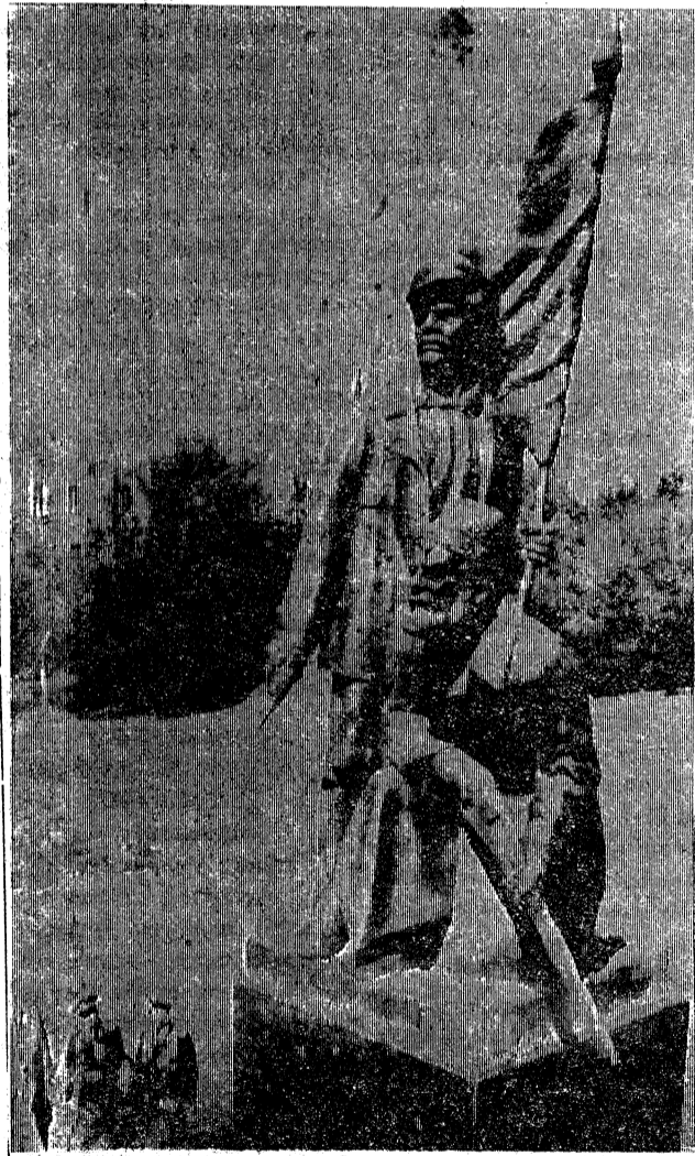
НА СНИМКЕ: памятник борцам за Советскую власть в Тюмени.

Г. МИНГАЛЕВ. (Подготовлено по материалам книги «400 лет Тюменской буржуазно-демократической революции, 1917—1918 гг.», Средне-Уральское книжное издательство, 1985 г.).