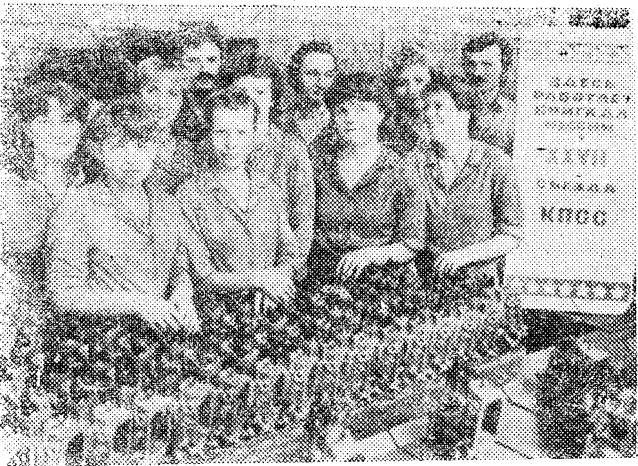
На снимке: комсомольско-молодежная бригада имени XXVII съезда КПСС цеха общей сборки топливных насосов — победитель социалистического соревнования. Ее усилиями обеспечен выпуск 440 сверхплановых насосов с начала года.

В течении заболевания различаются три стадии. Инкубационный период продолжается от 12 до 90 дней, а иногда — до года. Это связано