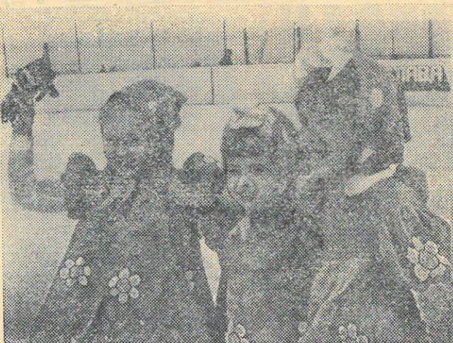
МАГНИТОГОРСК. Несколько лет работает в городском Дворце пионеров и школьников секция юных фигуристов. Здесь занимаются дети от шести до шестнадцати лет. При секции есть класс хореографии. На снимке: юные фигуристки.