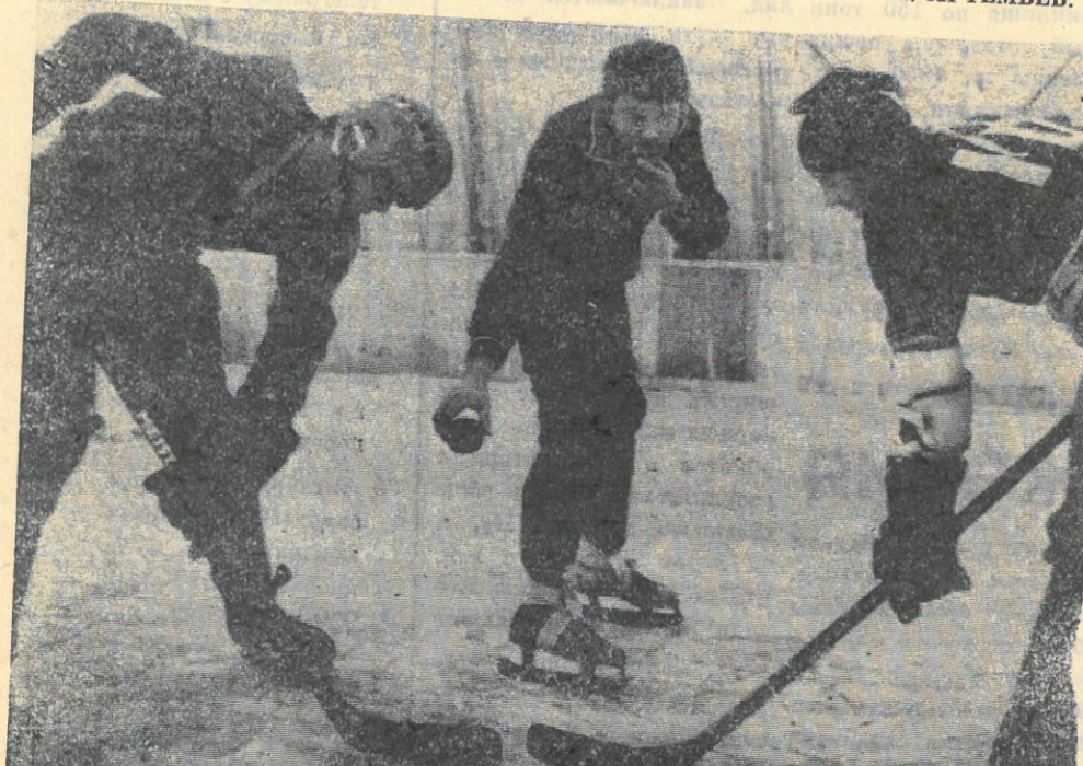
В поселке Уренгой, как мы уже сообщали, действует, кстати, первый в нашем округе, крытый хоккейный корт. Каждый вечер а особенно в выходные дни, здесь идут жаркие спортивные баталии.

7.00 — Утренняя зарядка. Мультфильм. Музыка. 7.30 — «Время». 8.15 — Герои С. Михалкова на экране. «Красный галстук». 9.25 — Концерт. 9.35 — «Переступить черту». Худ. телефильм. 1-я серия — «Бумажный змей». 11.05 — Концерт. 12.10 — Сегодня в мире. 15.30 — Новости. 15.45 — «Запевала». Телеочерк. 16.15 — Мультфильм. 17.00 — «...До шестнадцати и старше». 17.45 — «Алкогольный обман». Научно-