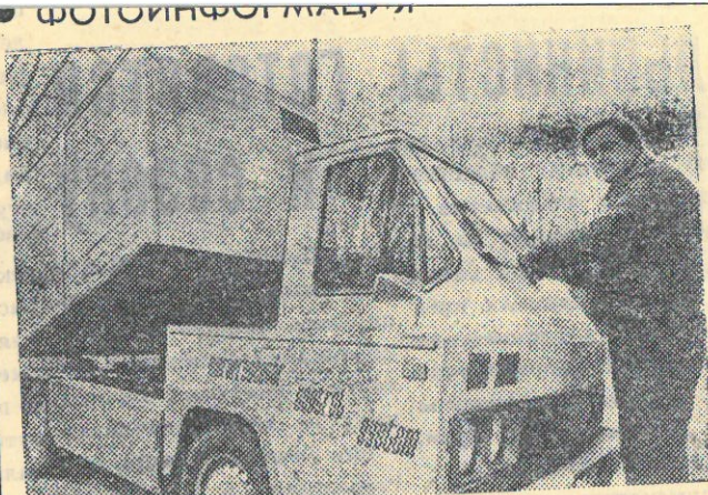
Украинская ССР. На новом электромобиле, пред-назначенном для внутригородских малотоннажных пе-ревозок, регулировать все режимы работы будет мик-роЭМВ. Она разработана молодежным коллективом Киевского института электродинамики АН УССР. Ми-ниатюрный компьютер позволит увеличить межзаряд-ный пробег автомобиля, повысит надежность управле-ния им.