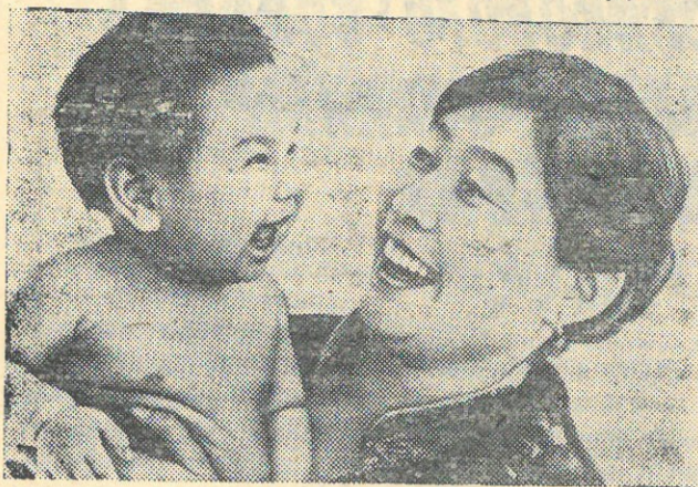
На снимках: счастливое материнство (МНР); маленький житель Исландии.