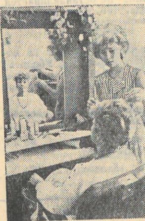
В Курской области начали свою деятельность семь кооперативов по бытовому обслуживанию населения. Около тридцати видов услуг может оказывать свой художественный салон.

И. КОТКОВ, начальник отдела уголовного розыска РОВД.